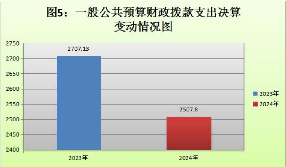
(图 5：一般公共预算财政拨款支出决算变动情况) (柱状图)

2024 年度一般公共预算财政拨款支出 2507.85 万元，占本年支出合计的 95.2%。与 2023 年度相比，一般公共预算财政拨款支出减少 199.28 万元，减少 7.4%。主要变动原因是 2024 年较上年减少了项目支出。