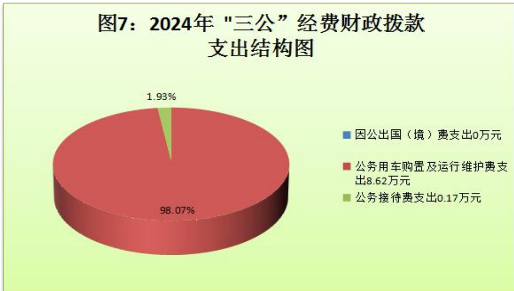
（图 7：“三公”经费财政拨款支出结构）（饼状图）

1. 因公出国（境）经费支出 0 万元 ，完成预算 100%。全年安排因公出国（境）团组 0 次，出国（境）0 人。因公出国（境）支出决算比 2023 年持平。