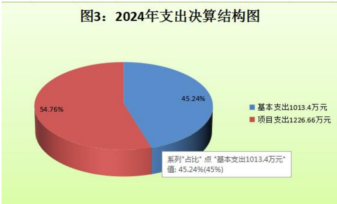
图3：2024年支出决算结构图

2024 年度本年支出合计 2240.06 万元，其中：基本支出 1013.4 万元，占 45.24%；项目支出 1226.66 万元，占 54.76%；