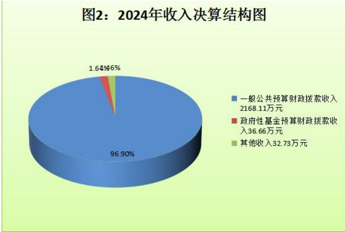
(图 2：收入决算结构图) (饼状图)