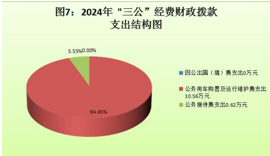
图7：2024年“三公”经费财政拨款支出结构图