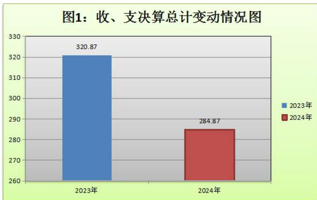
(图 1：收、支决算总计变动情况图) (柱状图)

2024 年度收、支总计均为 284.86 万元。与 2023 年度相比，收、支总计各减少 36.01 万元，减少 11.22%。主要变动原因是日常开支减少。