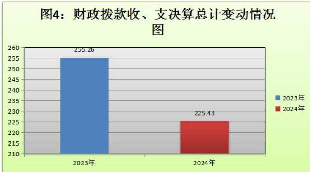
(图 4：财政拨款收、支决算总计变动情况) (柱状图)

2024 年度财政拨款收、支总计均为 225.43 万元。与 2023 年度相比，财政拨款收、支总计各减少 29.83 万元，减少 11.69%。主要变动原因是特困人员生活费项目资金调标。