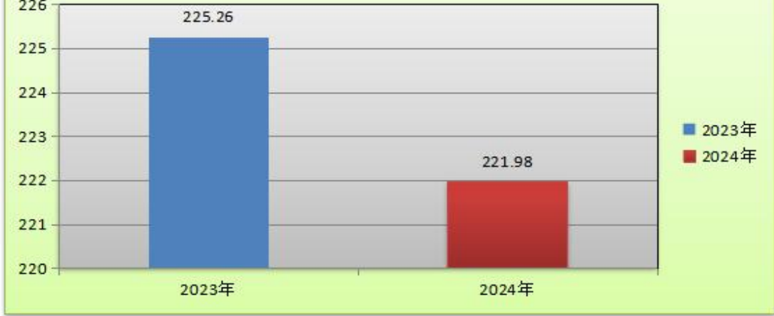
(图 5：一般公共预算财政拨款支出决算变动情况) (柱状图)