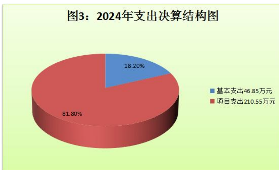
(图 3：支出决算结构图) (饼状图)

2024 年度本年支出合计 257.4 万元，其中：基本支出 46.85 万元，占 18.2%；项目支出 210.55 万元，占 81.8%。