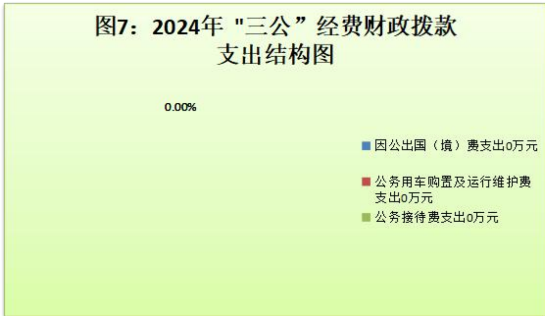
图7：2024年“三公”经费财政拨款支出结构图