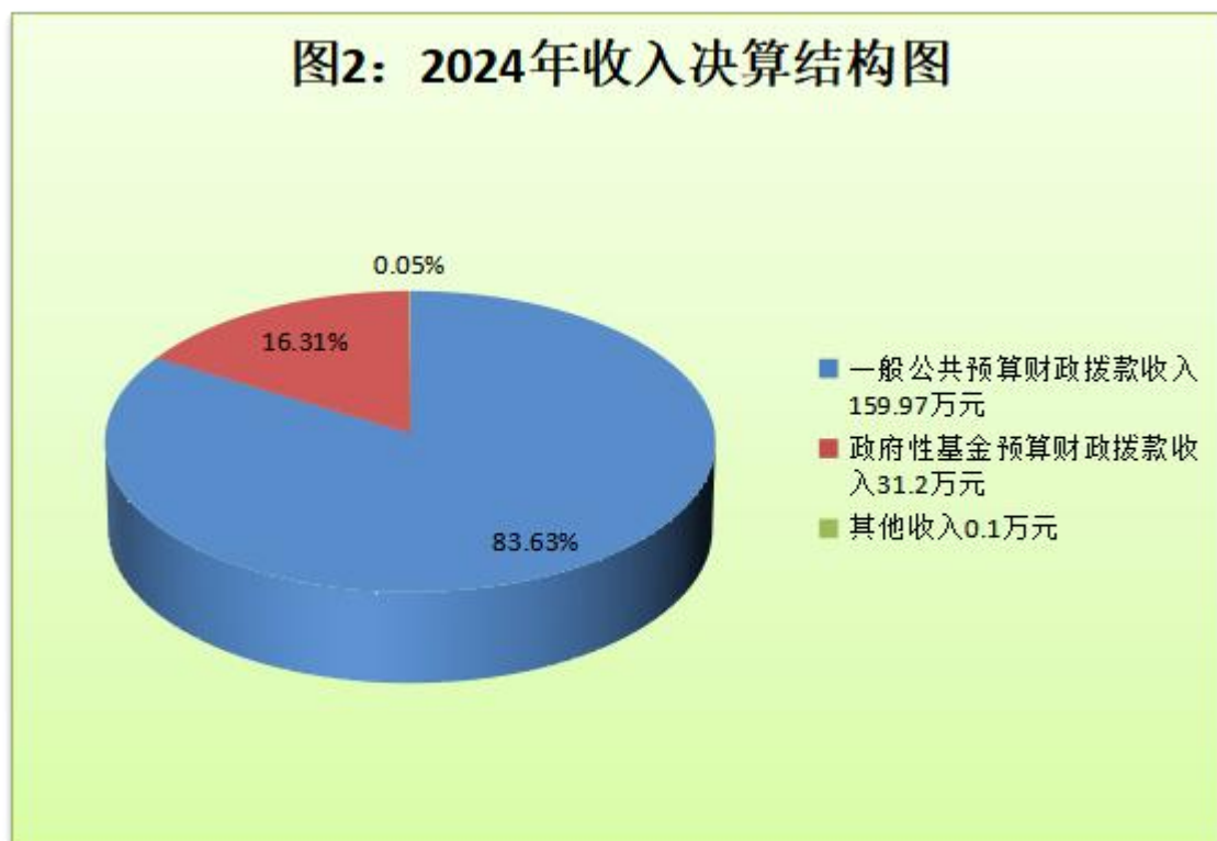
（图 2：收入决算结构图）（饼状图）