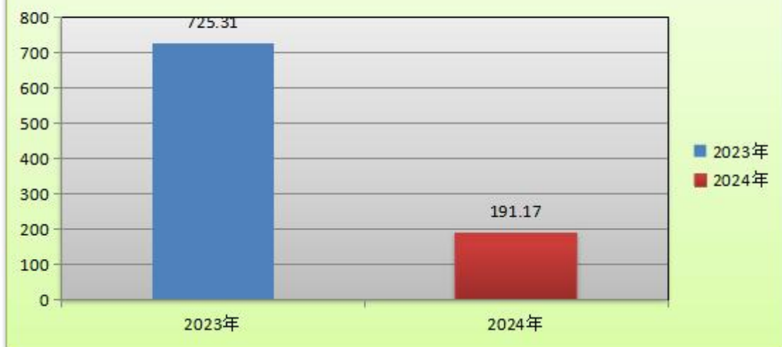
图4：财政拨款收、支决算总计变动情况图