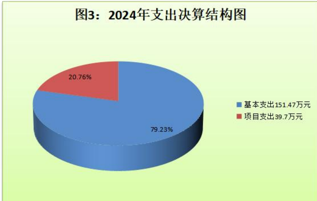
（图 3：支出决算结构图）（饼状图）