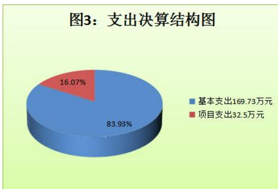
（图 3：支出决算结构图）（饼状图）

2024 年度本年支出合计 202.23 万元，其中：基本支出 169.73 万元，占 83.93%；项目支出 32.50 万元，占 16.07%；上缴上级支出 0 万元，占 0%；经营支出 0 万元，占 0%；对附属单位补助支出 0 万元，占 0%。