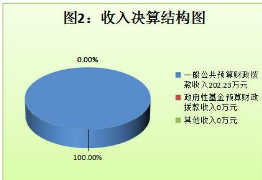
（图 2：收入决算结构图）（饼状图）