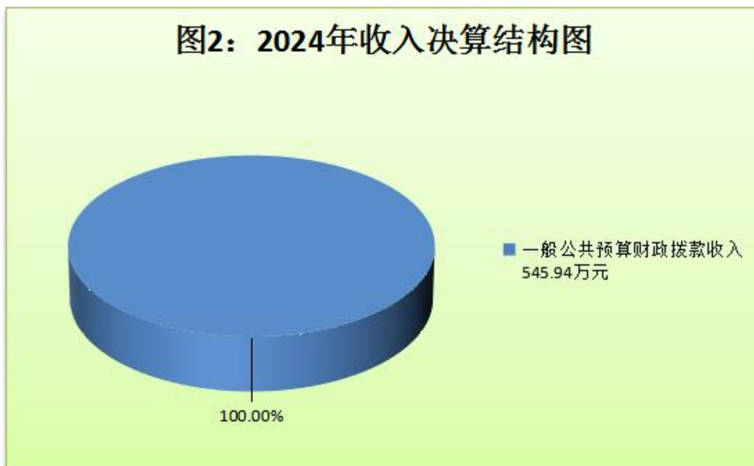
(图 2：收入决算结构图)(饼状图)