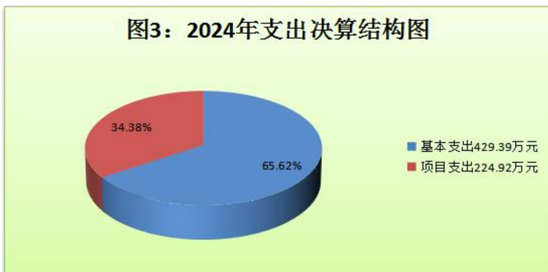
(图 3：支出决算结构图)(饼状图)