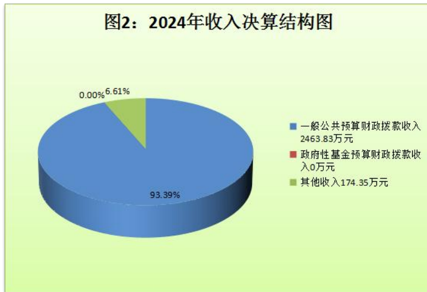
(图 2：收入决算结构图) (饼状图)