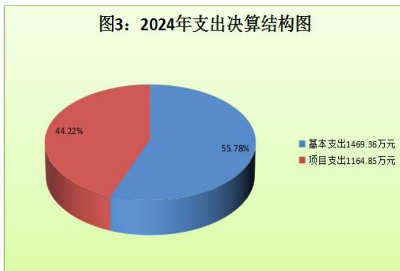
(图 3：支出决算结构图) (饼状图)

2024 年度本年支出合计 2634.22 万元，其中：基本支出 1469.36 万元，占 55.78%；项目支出 1164.85 万元，占 44.22%；上缴上级支出 0 万元，占 0%；经营支出 0 万元，占 0%；对附属单位补助支出 0 万元，占 0%。