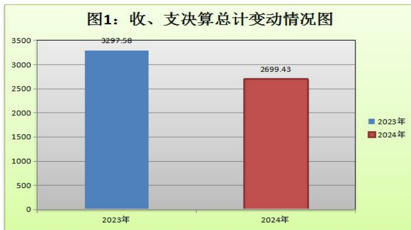
(图 1：收、支决算总计变动情况图) (柱状图)

2024 年度收入、支出总计均为 2699.43 万元。与 2023 年度相比，收、支总计各下降 598.15 万元，下降 18.14%。主要变动原因是 2024 年度无政府性基金预算财政拨款收入和国有资本经营预算财政拨款收入，减少了项目支出。