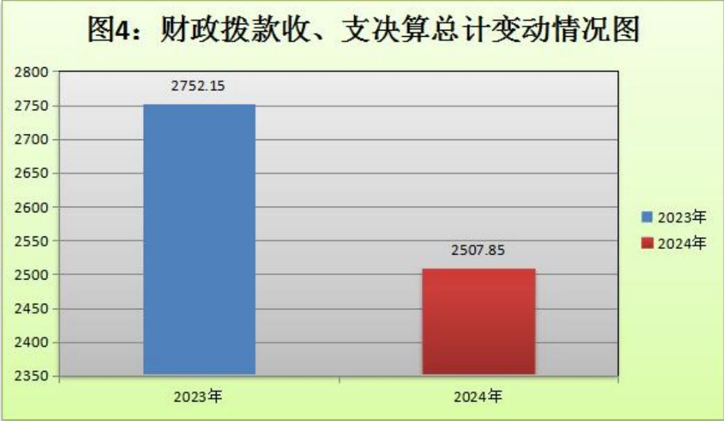
(图 4：财政拨款收、支决算总计变动情况) (柱状图)

2024 年度财政拨款收、支总计均为 2507.85 万元。与 2023 年度相比，财政拨款收、支总计减少 244.3 万元，下降 8.9%。主要变动原因是 2024 年度无政府性基金预算财政拨款收入和国有资本经营预算财政拨款收入。