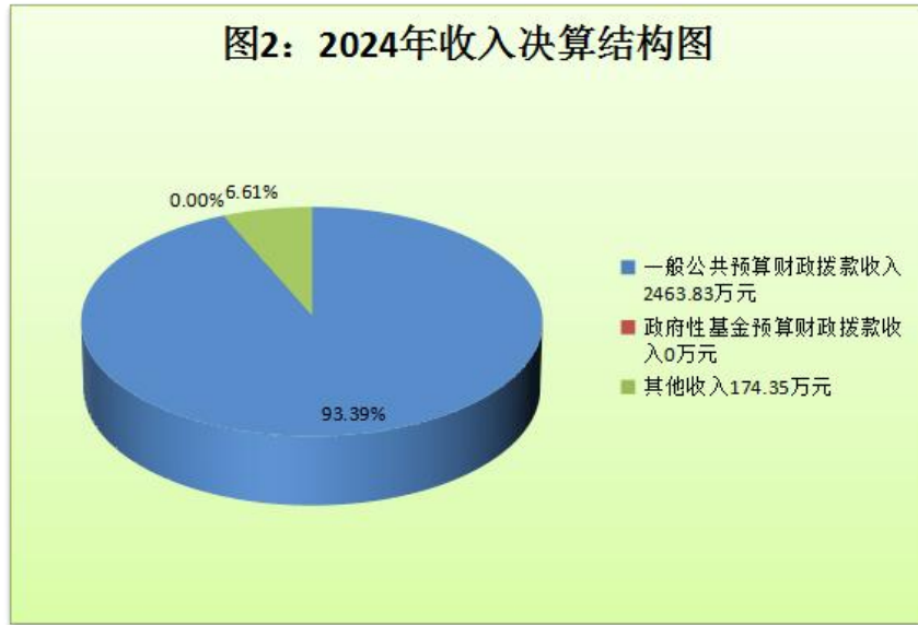
（图 2：收入决算结构图）（饼状图）