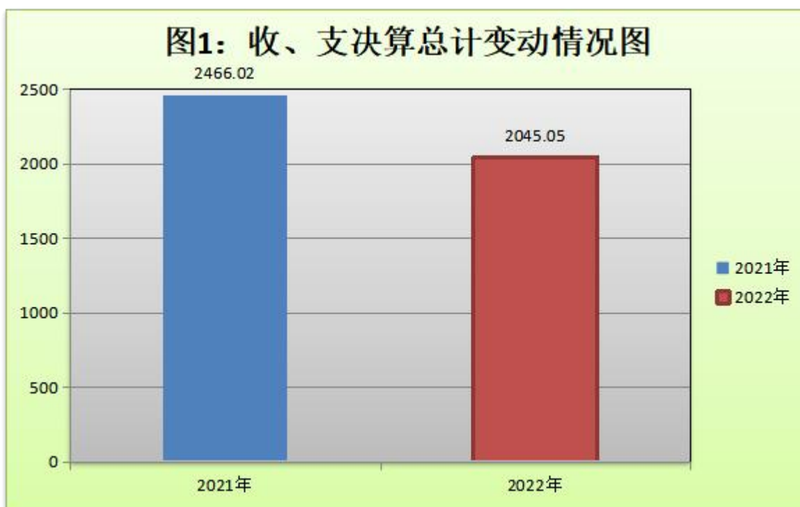
(图1：收、支决算总计变动情况图)

2022年度收、支总计2,045.05万元。与2021年相比，收、支总计各减少420.97万元，下降17.1%。主要变动原因是疫情期期间文化活动、体育活动、比赛项目、旅游项目等减少。