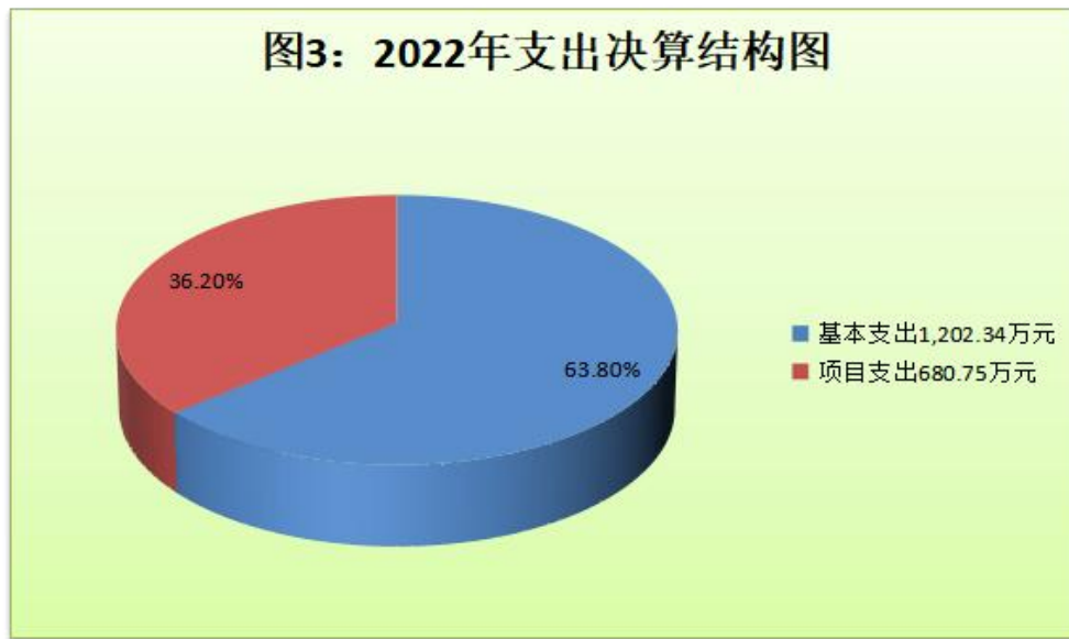
(图3：支出决算结构图)