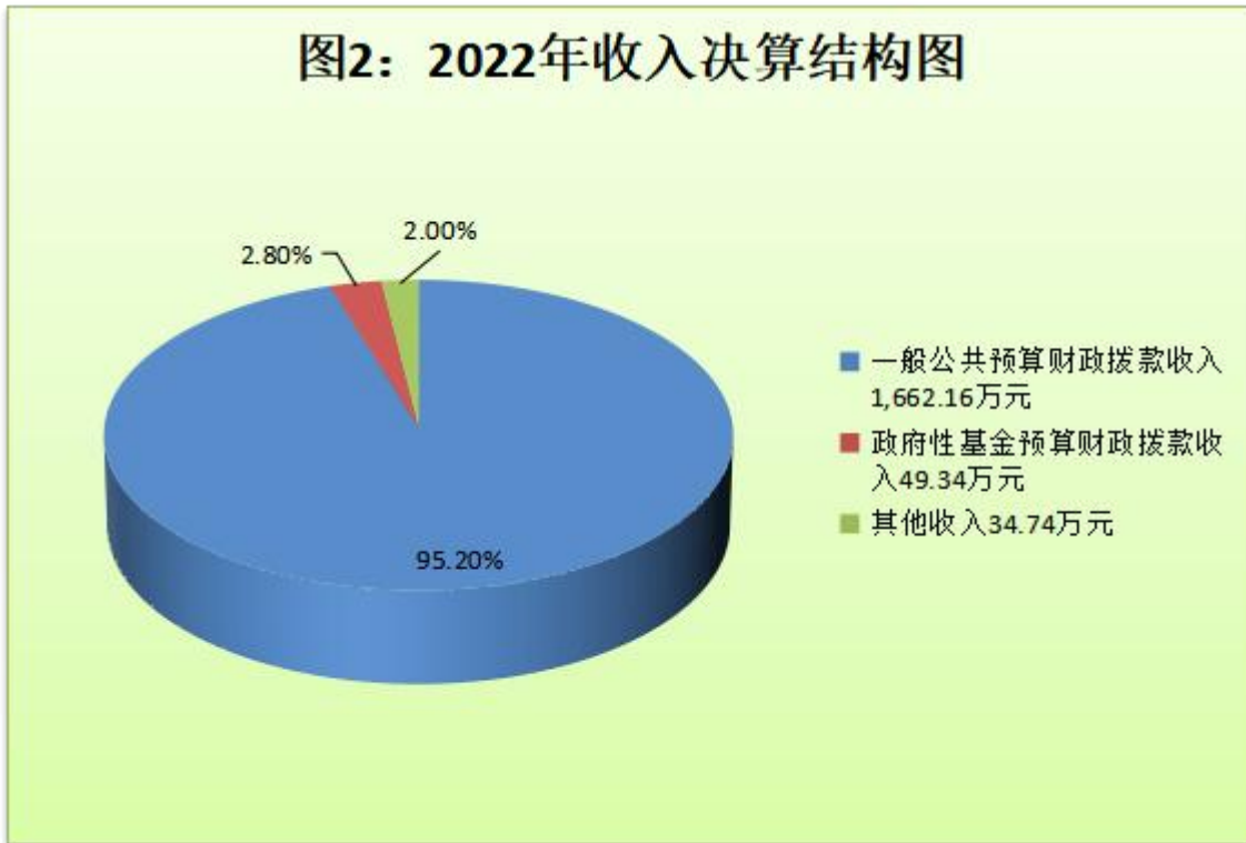
(图2：收入决算结构图)

万元，占0%；上级补助收入0万元，占0%；事业收入0万元，占0%；经营收入0万元，占0%；附属单位上缴收入0万元，占0%；其他收入34.74万元，占2%。