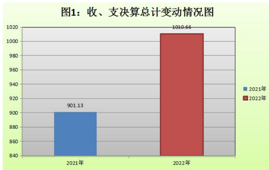
(图1: 收、支决算总计变动情况图)(柱状图)

2022年度收、支总计1,010.66万元。与2021年相比，收、支总计各增加109.53万元，增长12.2%。主要变动原因是2022年增加基础绩效工资收入和支出。