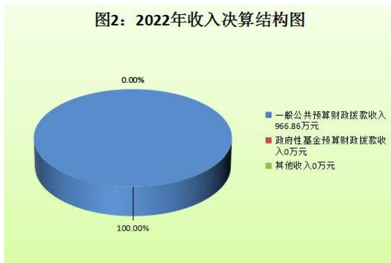
(图2：收入决算结构图) (饼状图)