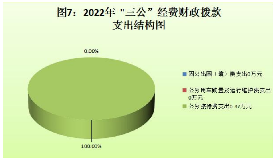
（图7：“三公”经费财政拨款支出结构）（饼状图）

2022年“三公”经费财政拨款支出决算中，因公出国（境）费支出决算0万元，占0%；公务用车购置及运行维护费支出决算0万元，占0%；公务接待费支出决算0.37万元，占100%。具体情况如下：