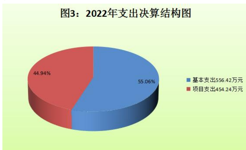
(图3：支出决算结构图) (饼状图)

2022年本年支出合计1,010.66万元,其中:基本支出556.42万元,占55.1%;项目支出454.24万元,占44.9%;上缴上级支出0万元,占0%;经营支出0万元,占0%;对附属单位补助支出0万元,占0%。