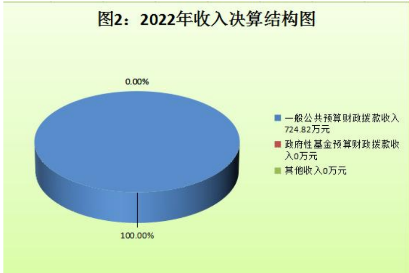
(图2：收入决算结构图) (饼状图)