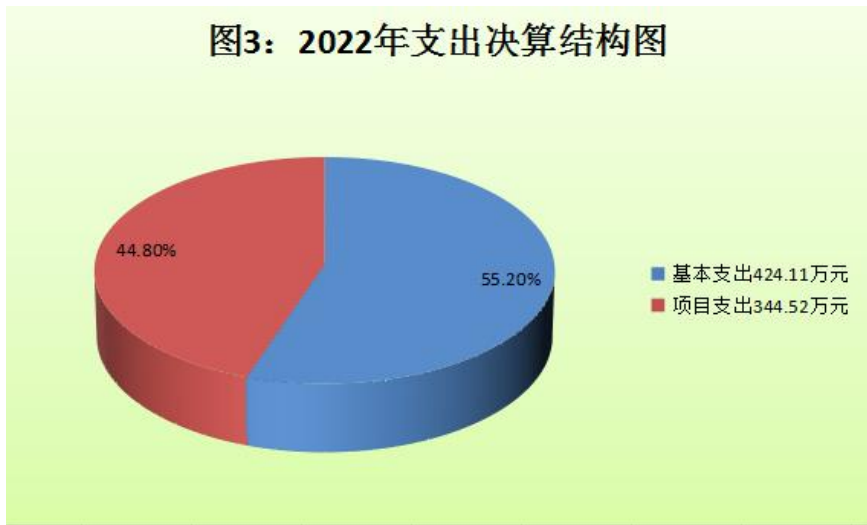
(图3：支出决算结构图) (饼状图)

2022年本年支出合计768.62万元，其中：基本支出424.11万元，占55.2%；项目支出344.52万元，占44.8%；上缴上级支出0万元，占0%；经营支出0万元，占0%；对附属单位补助支出0万元，占0%。