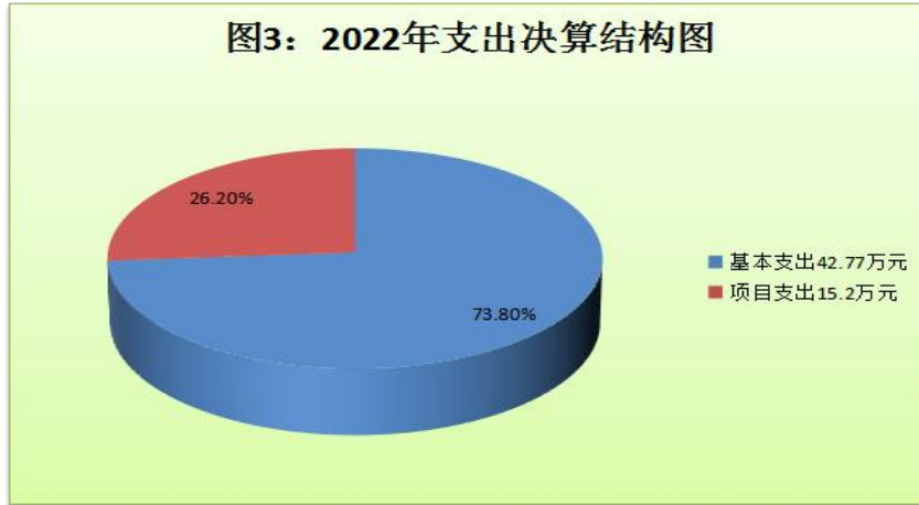
(图3：支出决算结构图)(饼状图)