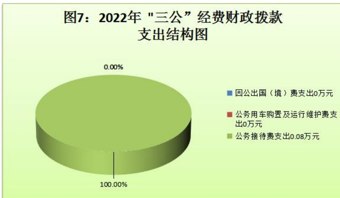
(图7：“三公”经费财政拨款支出结构)(饼状图)

1. 因公出国(境)经费支出0万元，完成预算0%。全年安排因公出国(境)团组0个，出国(境)0人。因公出国(境)支出决算与2021年持平。