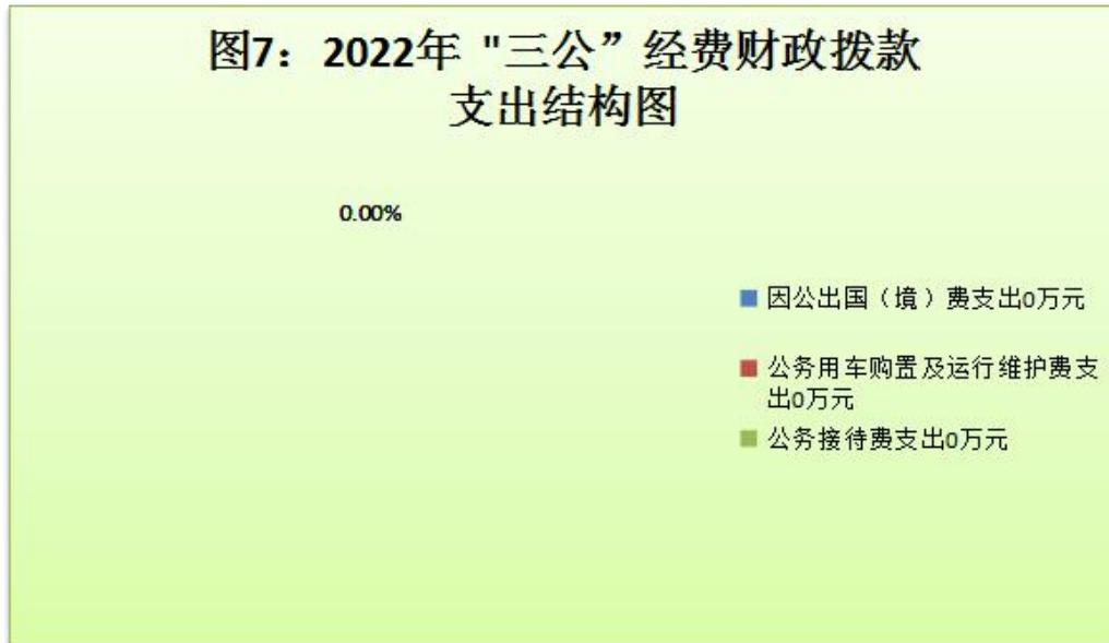
图7：2022年“三公”经费财政拨款支出结构图