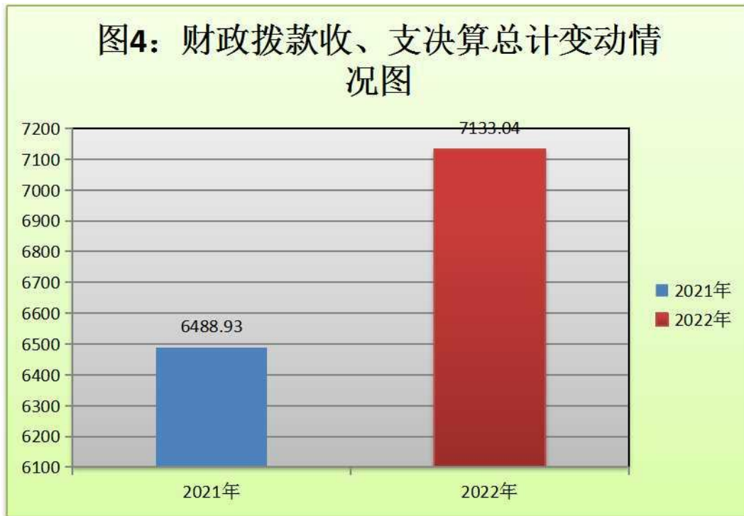
（图 4：财政拨款收、支决算总计变动情况）（柱状图）