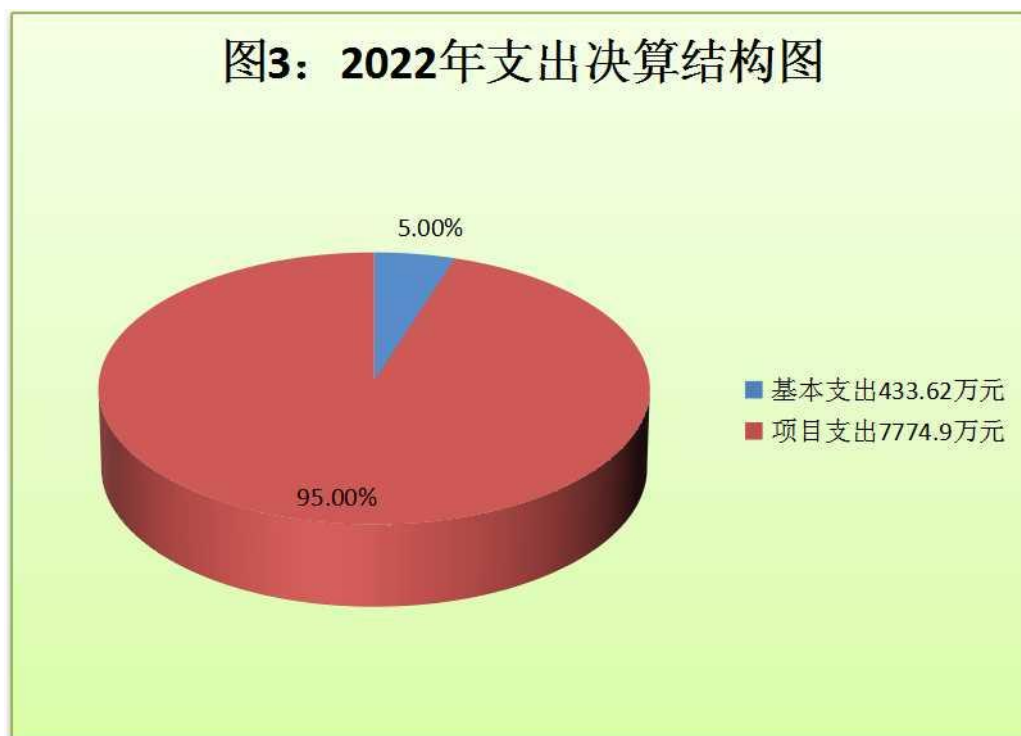
（图 3：支出决算结构图）（饼状图）