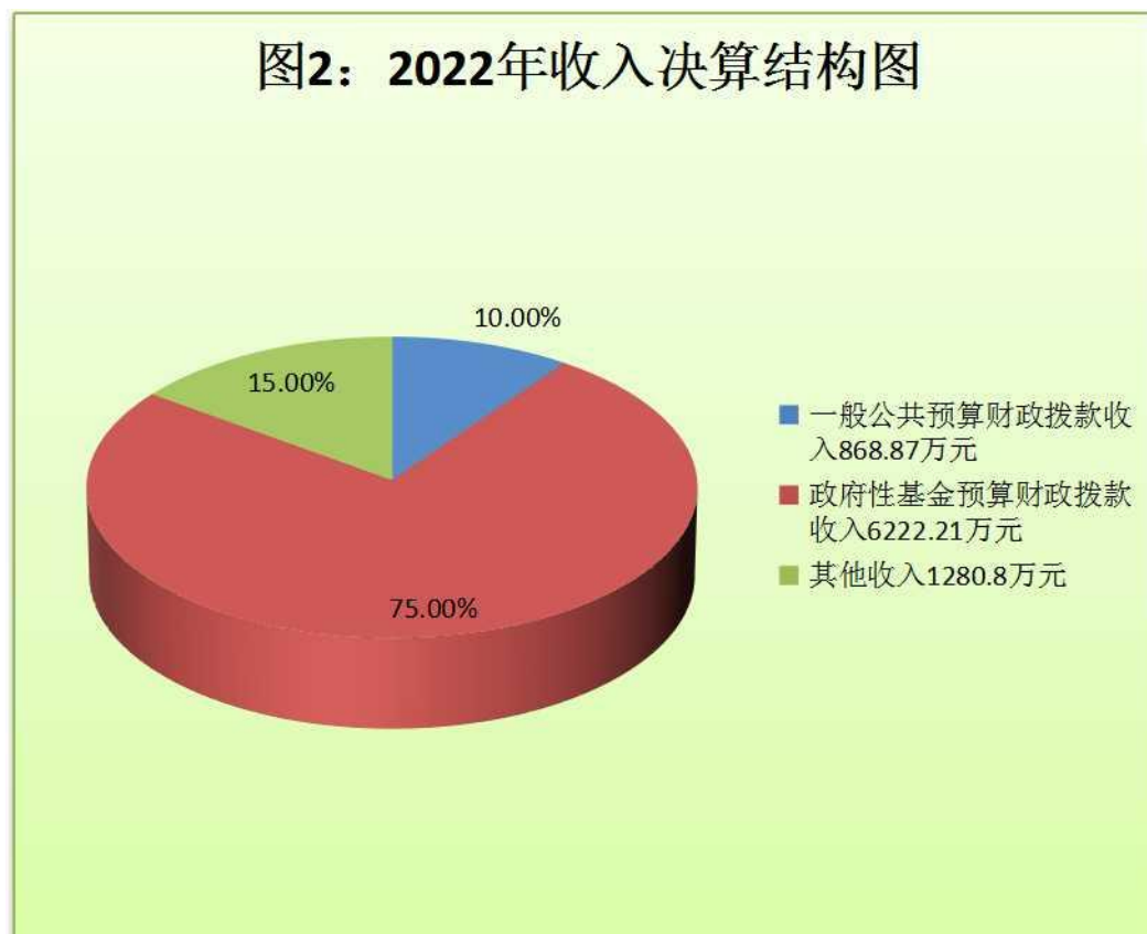
（图 2：收入决算结构图）（饼状图）