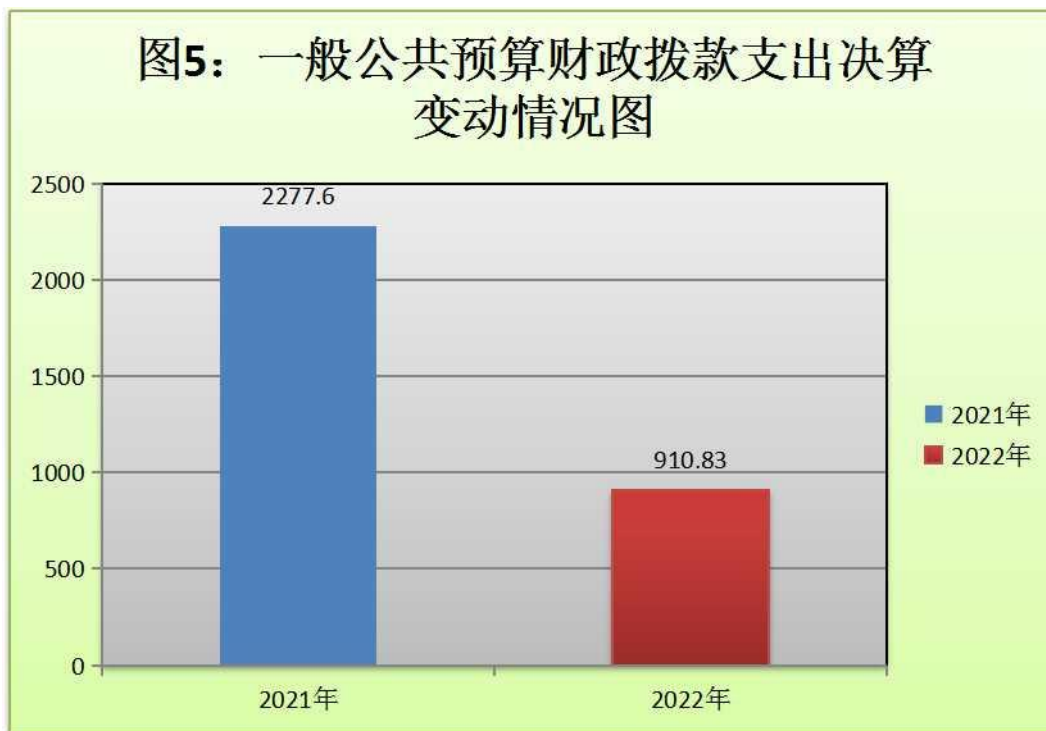
(图 5：一般公共预算财政拨款支出决算变动情况)