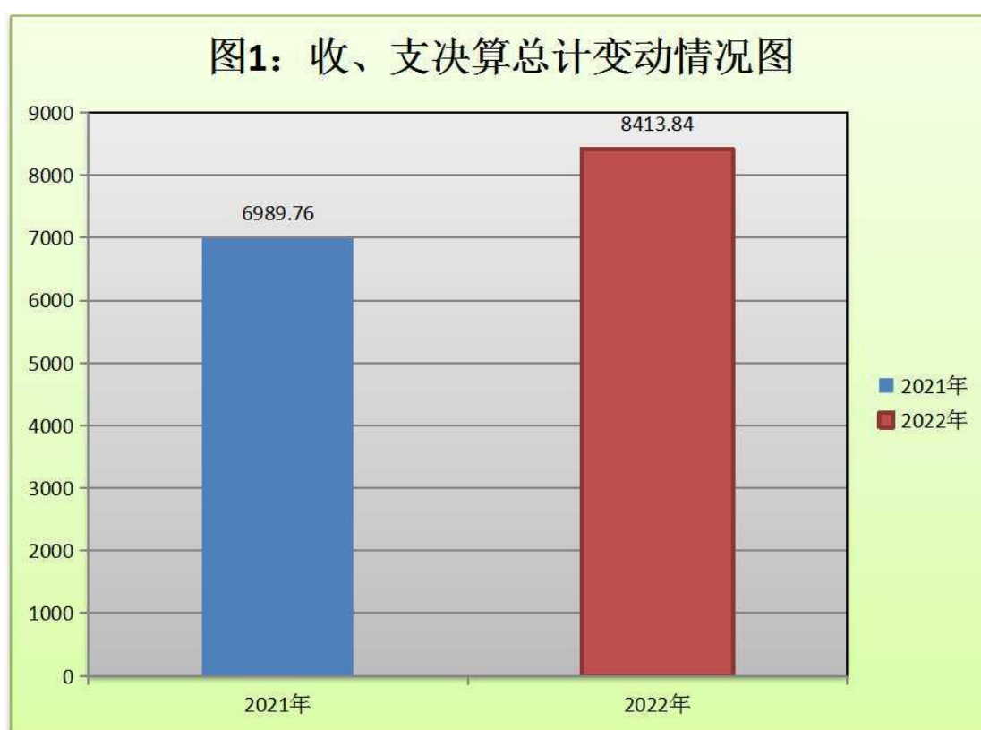
(图 1：收、支决算总计变动情况图) (柱状图)

2022 年度收、支总计 8413.84 万元。与 2021 年相比，收、支总计各增加 1424.08 万元，增长 20%。主要变动原因是政府性基金预算财政拨款收入增加。