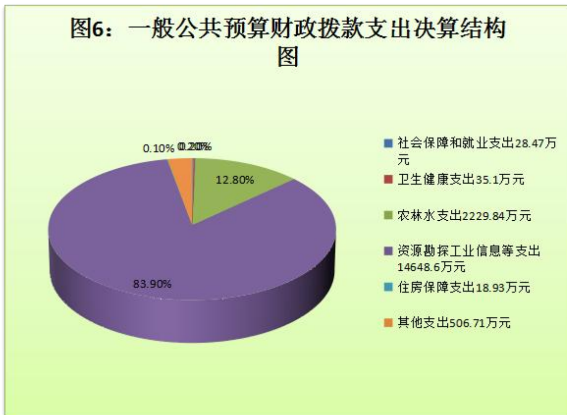
(图6：一般公共预算财政拨款支出决算结构)

万元，占0%；援助其他地区支出0万元，占0%；自然资源海洋气象等支出0万元，占0%；住房保障支出18.93万元，占0.1%；粮油物资储备支出0万元，占0%；国有资本经营预算支出0万元，占0%；灾害防治及应急管理支出0万元，占0%；其他支出506.71万元，占2.9%；债务还本支出0万元，占0%；债务付息支出0万元，占0%；抗疫特别国债安排的支出0万元，占0%。