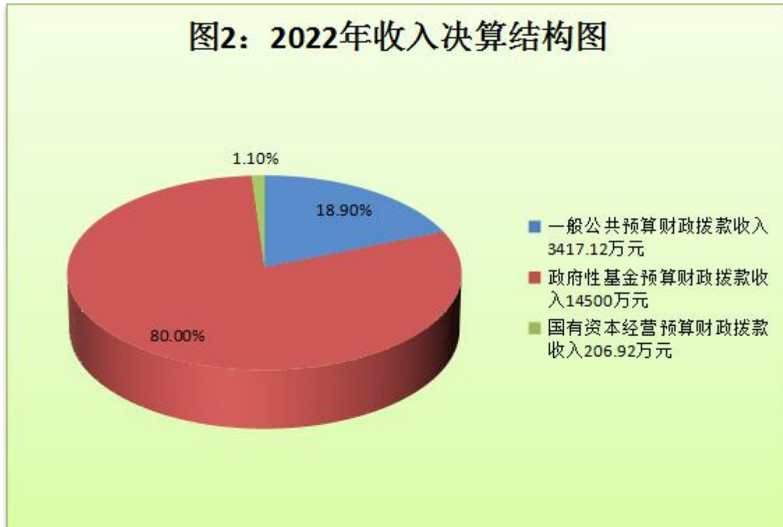
(图2：收入决算结构图)

206.92万元，占1.1%；上级补助收入0万元，占0%；事业收入0万元，占0%；经营收入0万元，占0%；附属单位上缴收入0万元，占0%；其他收入0万元，占0%。