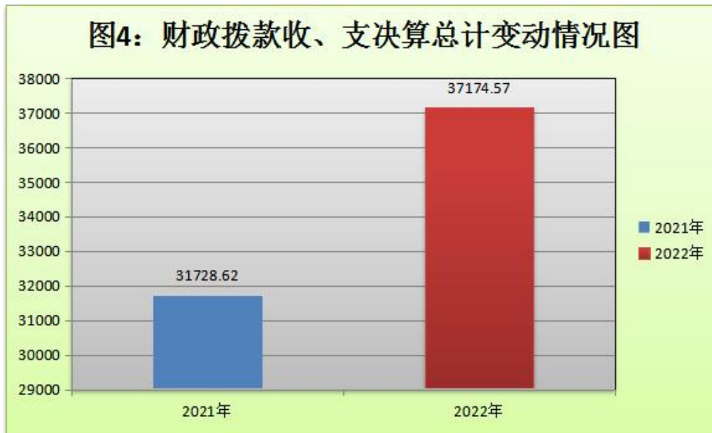
（图4：财政拨款收、支决算总计变动情况）