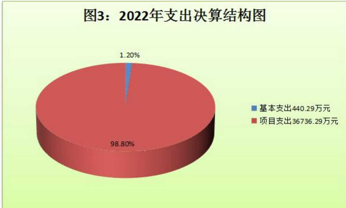
（图3：支出决算结构图）