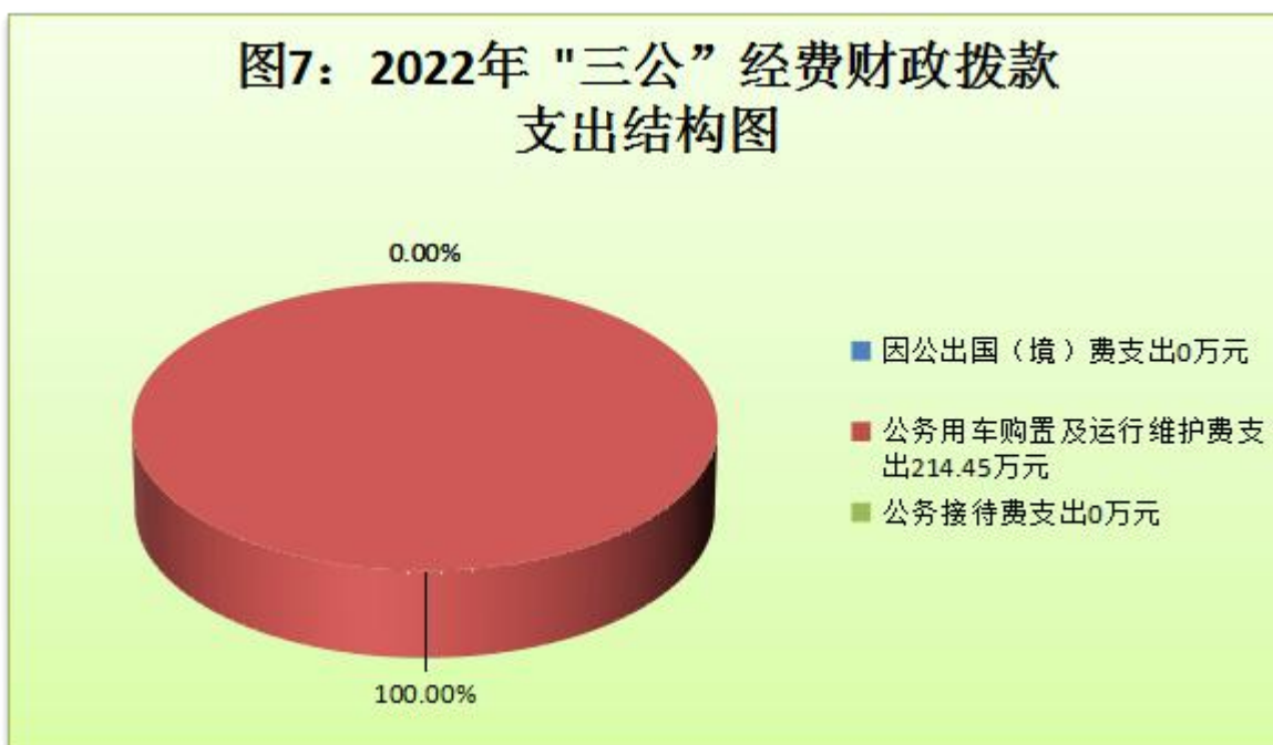
（图7：“三公”经费财政拨款支出结构）

1. 因公出国（境）经费支出0万元，完成预算0%。全年安排因公出国（境）团组0个，出国（境）0人。因公出国（境）支出决算比2020年持平0万元。